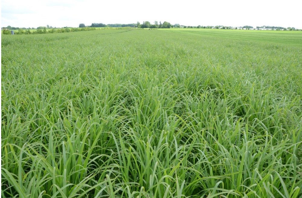
Billede 2. Veletableret mekanisk renholdt mark i Låsby 2015.

Det vigtigste resultat - at det er muligt at etablere og renholde tækkemiscanthus, udelukkende ved anvendelse af mekanisk ukrudtsbekæmpelse – er en forudsætning for, at denne plante vil kunne finde udbredelse i vandindvindingsområder som erstatning for eller supplement til skovrejsning og/eller agro forestry.