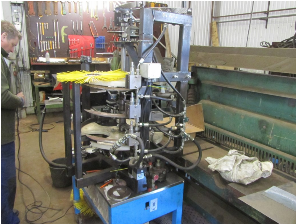
Billede 17. Udvikling af bindeapparat til høstmaskine ved Bjarne Hansen.