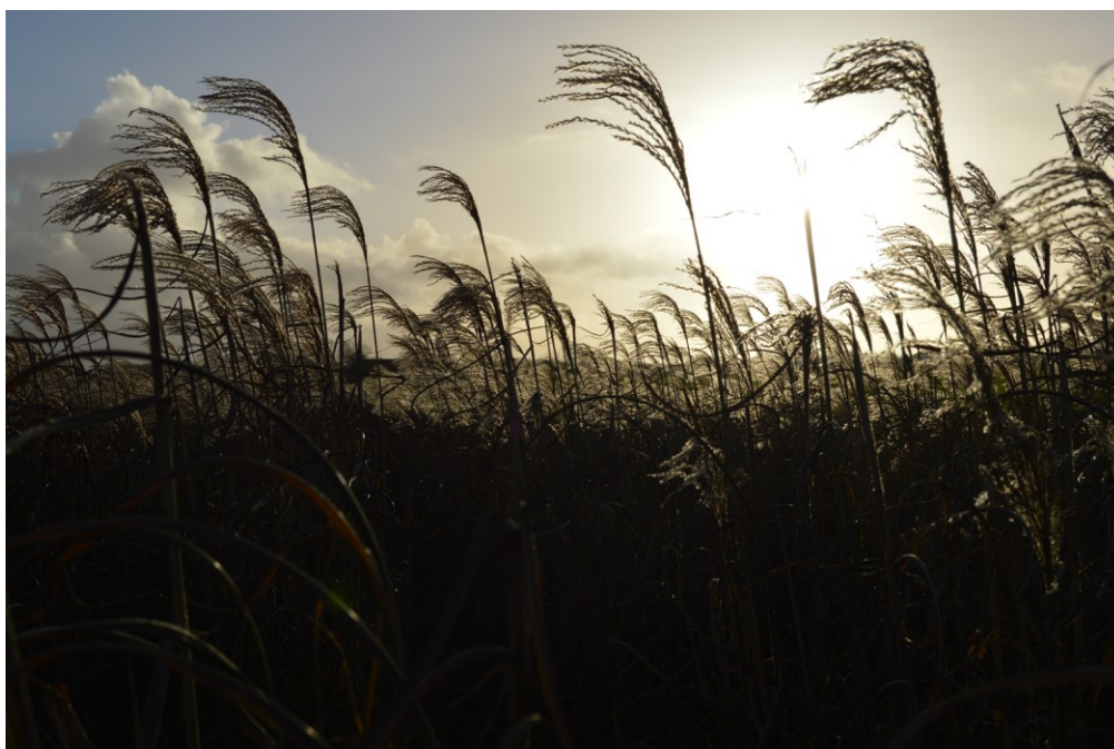
Billede 19. Låsbymarken i december 2014.