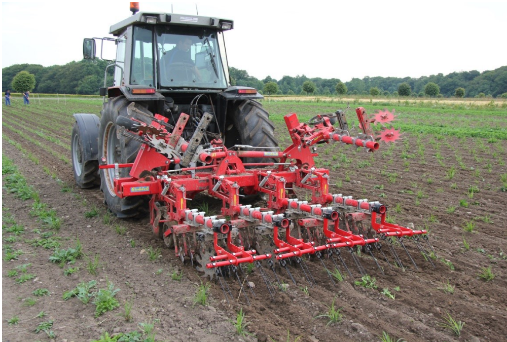
Billede 3. Radrensning i Låsby.