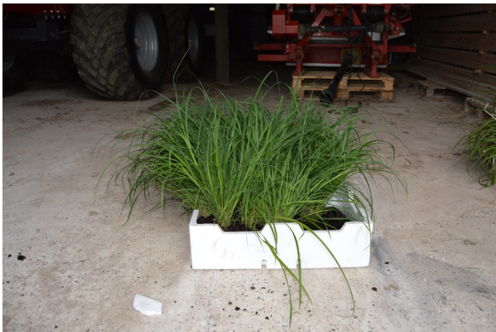
Billede 15. Barrodsplanter i mini-tørveurtepotter. De kraftige barrodsplanter overlevede bedst.

denne metode arbejdes der med mange planter, som skal skilles ad lige inden udplantning. Derfor er der her flere planter i hver plug, og der kan anvendes en plantemaskine, som normalt bruges til plantning af træer. En af fordelene ved barrodsplantning er, at det er muligt at sætte elefantgræsset længere ned i jorden, og det øger overlevelsesmuligheden i tørre perioder.