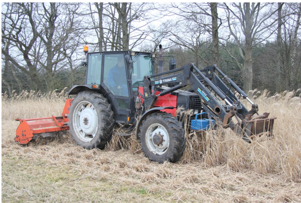
Billede 6. Afpudsning af tækkemiscanthus i 2. dyrkningsår.

en maskine, som forventes leveret i 2018, når den er færdigudviklet i forlængelse af maskinudviklingen i regi af dette projekt.