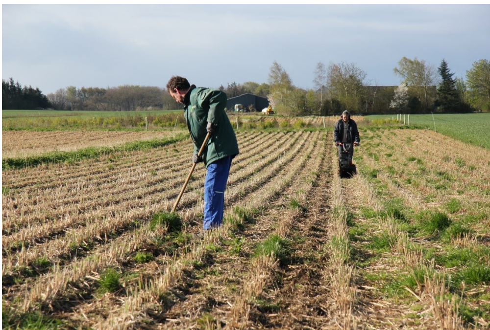
Billede 4. Rækkefræsning og hakning i rækken i 2015.

I andet dyrkningsår fortsættes der med rækkefræsning samt hakning i selve rækkerne. Projektet har vist, at det kan være vanskeligt at radrense i 2. dyrkningsår pga., at bladene vil slæbe. Rækkefræsning er derfor at foretrække. I det 3. dyrkningsår kan afgrøden normalt klare sig selv, fordi bladfaldet virker som direkte ukrudtsbekæmpelse.