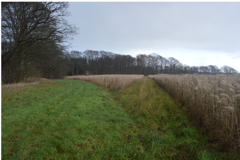
Billede 10. Kombination af vildtagre og tækkemiscanthus.

Julianelyst har derfor allerede besluttet at tilplante yderligere 1,5 hektar i 2018. Tækkemiscanthus på godset placeres primært i tilknytning til skov, altså en slags agro forestry.