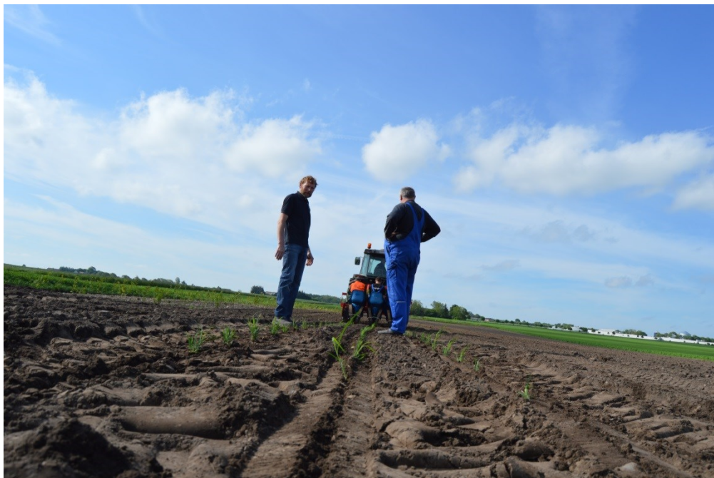
Billede 1. Plantning i Låsby 27. maj 2014.

Der er desuden samarbejdet med Vitroform Aps, Miscanthus.dk A/S og Aarhus Vand A/S (som trak sig fra samarbejdet tidligt pga. Landbrug og Fødevarers kritiske holdning til Aarhus kommunes indsatsplaner med varslet forbud mod anvendelse af pesticider).