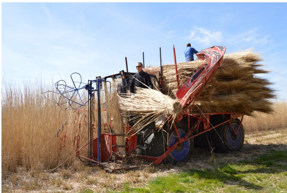
Billede 18. Høst af tækkemiscanthus i Låsby 2. maj 2017.

Der har i et par årtier været arbejdet på at udvikle denne fuldautomatiske høste- og rensemaskine til tagrørshøst – både i Danmark, Holland og Tyskland – og det er endnu ikke lykkedes. Udfordringerne må derfor skønnes at være ret store, samtidig med at tækkebranchen internationalt set er så relativt lille, at ingen af de helt store entreprenør- og landbrugsmaskineproducenter er gået ind i udviklingsarbejdet med de ressourcer, disse multinationale selskaber har.