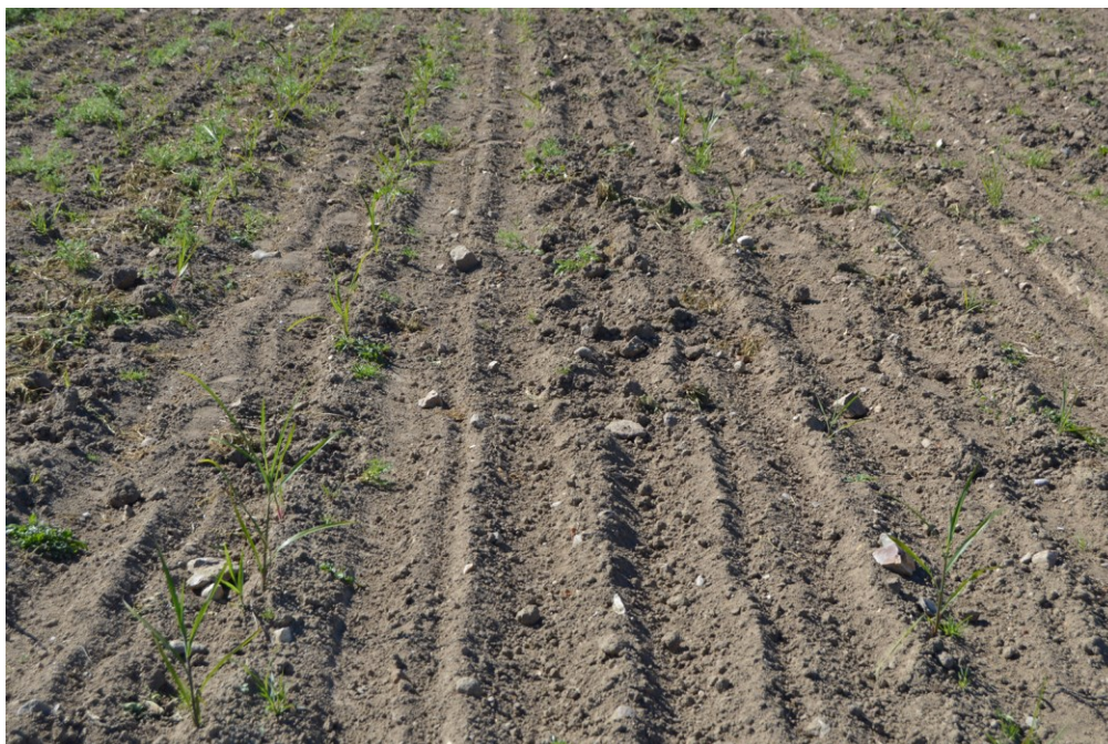
Billede 9. Barrodsplanter med 70 procent succes 2 uger efter plantning.