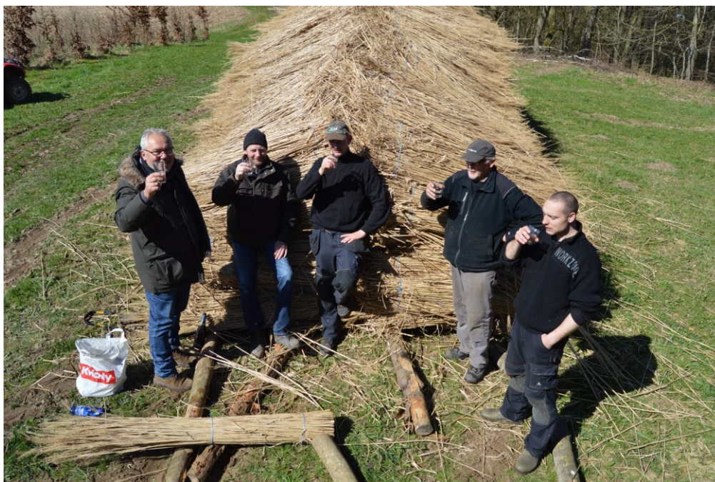
Billede 8. Den første høst i Låsby er i hus i 2016.