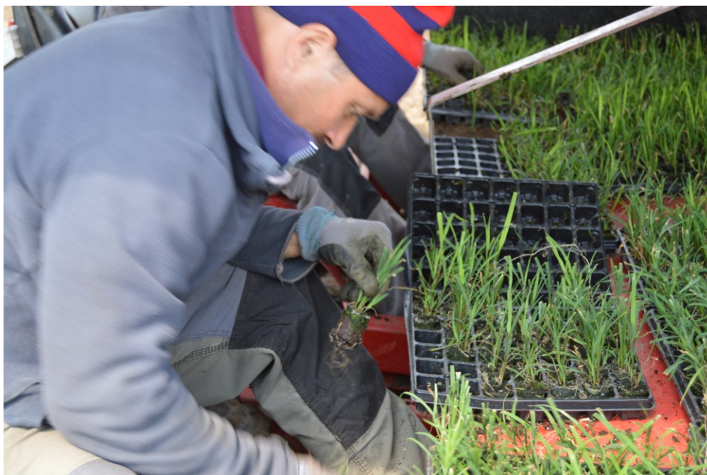
Billede 16. Tækkemiscanthus etableret i plugs efter traditionel metode.

Denne metode er forsøgt afprøvet i projektet i 2015 hos en fritidslandmand med jord i et vandindvindingsområde i Aarhus Syd.