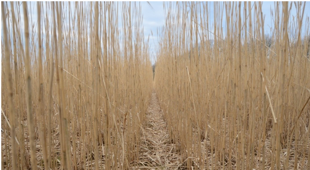
Billede 5. Bladfald 14. april inden høst i 3. dyrkningsår fungerer i høj grad som ukrudtsbekæmpelse.

Med hensyn til nitratudvaskning til grundvandet har Aarhus Universitets målinger af udvaskningen (med sugeceller) fra den først etablerede mark i projektet (etableret i 2014) vist, at planterne bruger alt tilført kvælstof, så der er en meget minimal udvaskning. (Mere herom senere).