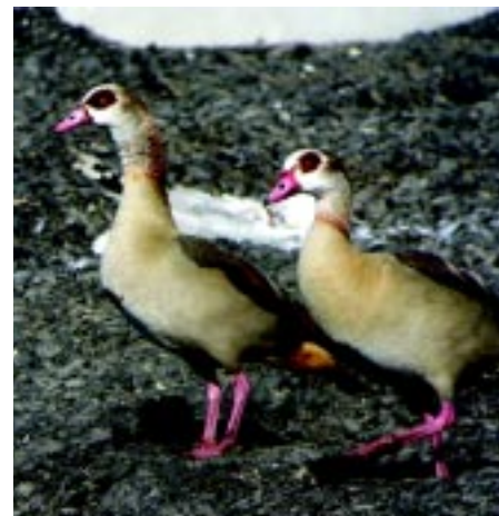
Nilgåsen er observeret flere steder i Danmark. På www.dof.dk kan man se hvor der er observeret både nilgås og amerikansk skarveand.

Vildtskadebekendtgørelsen åbner i det hele taget mulighed for at regulere de invasive vildtarter, som vi ønsker at begrænse væsentligt eller helt at udrydde fra den danske natur. Foruden nilgås og amerikansk skarveand er der også mulighed for regulering af mink, bisamrotte, mårhund, muflonvædder og vildsvin hele året.