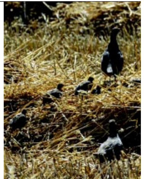
Et par agerhøns med kyllinger – en succes-historie fra området.

Regulering af rovdyr sker efter bestemmelserne om regulering af vildt. Fældefangst af husskade og krage foregår så effektivt og humant som muligt. I foråret blev der, takket være de nye regler med udvidet fangstperiode, fanget 95 krager og 28 skader.